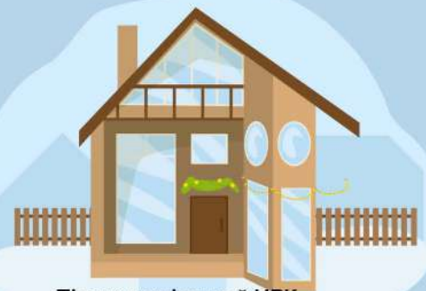
Підзахаричівський НВК "Перлина Гуцульщини"