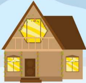
Розтоківський ЗЗСО I-III ступенів