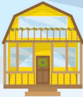
Усть-Путильський ЗЗСО I-II ступенів