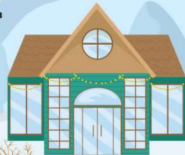
Мариничівський НВК "Родина"