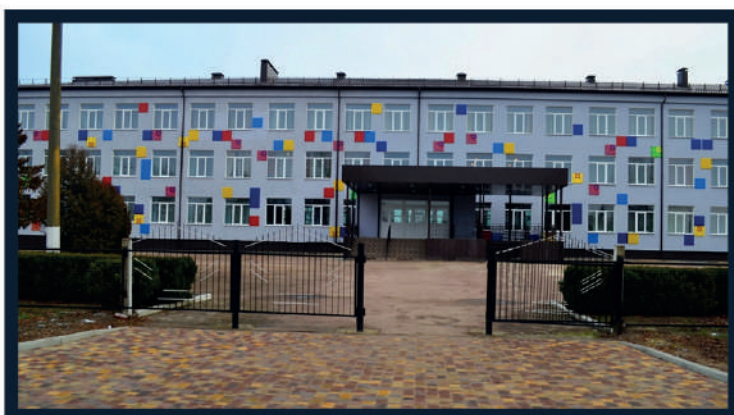
КОРЮКІВСЬКА ЗОШ I-III СТ №1