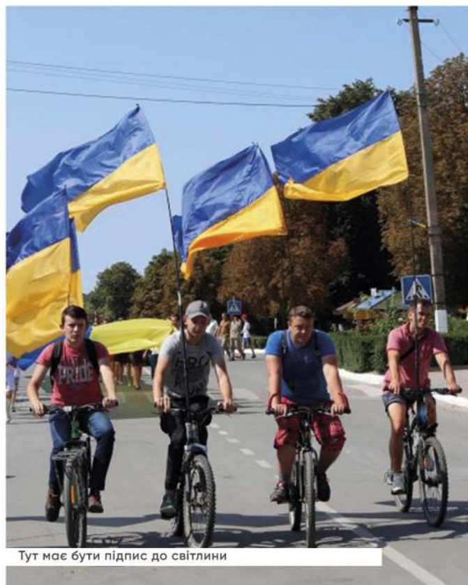
Тут має бути підпис до світлини