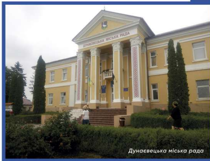
Дунаєвецька міська рада

В той самий час, бюджет для громадян допомагає визначити можливості для впливу на формування та витрачання бюджету своєї громади.