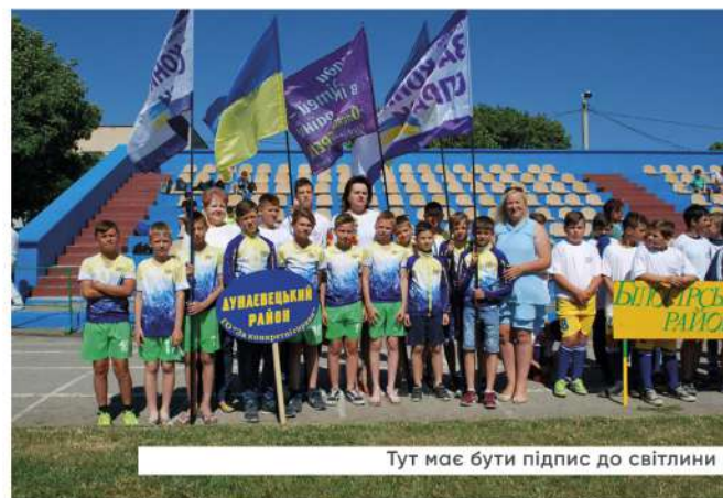
Тут має бути підпис до світлини

“ Один бюджетний цикл займає більше, ніж півтора календарних роки. Завершення одного бюджетного циклу фактично накладається на початок вже наступного бюджетного циклу. ”