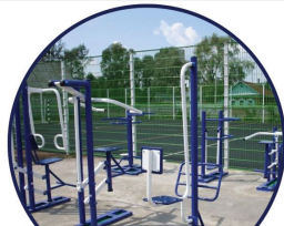
Спортивний майданчик для воркаута, ініціатор Володимир Нехлеса