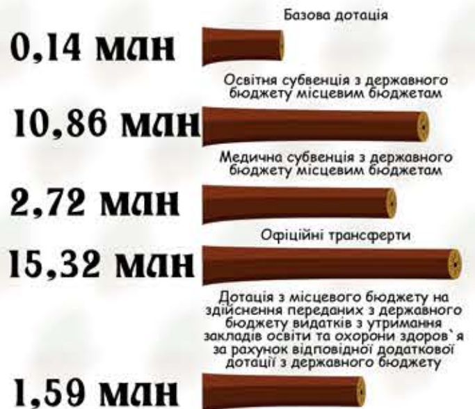
СТРУКТУРА ОФІЦІЙНИХ ТРАНСФЕРТІВ МОСТІВСЬКОЇ СІЛЬСЬКОЇ РАДИ НА 2018 Р.