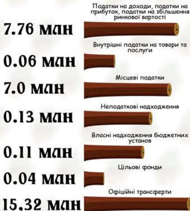
СТРУКТУРА ДОХОДІВ МОСТІВСЬКОЇ СІЛЬСЬКОЇ РАДИ НА 2018 Р.